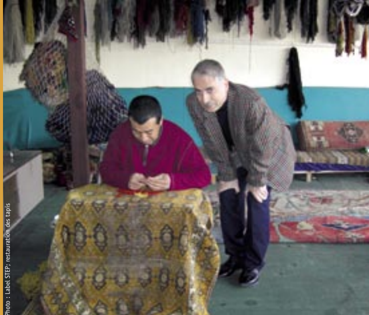
restauration des tapis