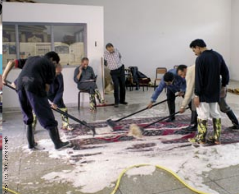
Photo : Label STEP, lavage de tapis